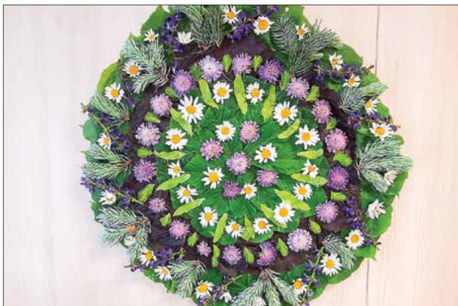
Mandala, ki so jo ustvarili v TD Rečica ob Savinji.