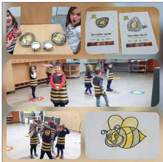
Tradicionalni slovenski zajtrk

V našem vrtcu že nekaj let sodelujemo v državnem projektu Zdravje v vrtcu pod okriljem Nacionalnega inštituta za javno zdravje. Tako vsako leto dobimo temo oz. rdečo nit vsebin, ki jih predstavljamo našim varovancem. Letošnja osrednja tema je namenjena dobremu počutju otrok.