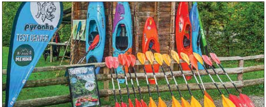
Največ zaslug za visoko uvrstitev Rečice ob Savinji ima glede na število postelj in obiskovalcev zagotovo Kamp Menina.