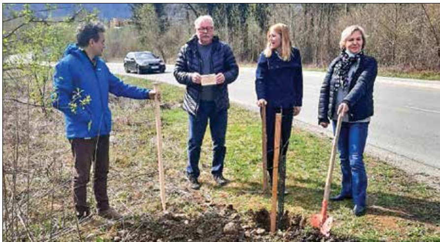
Prevzem podarjenih lip