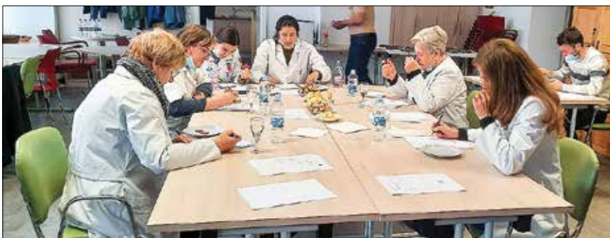
Komisija med ocenjevanjem