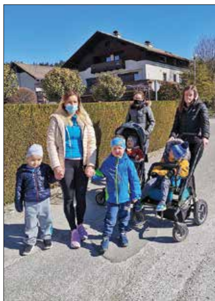
Črički na sprehodu

Narava je postala naša igralnica Zaradi neugodnih razmer zaradi epidemije se je tudi življenje v vrtcu precej spremenilo. Pristali smo v »mehurčku«. To pomeni, da druženja z ostalimi skupinami v vrtcu nimamo. Zato smo se skupina Medvedkov odločili, da še več časa preživimo v naravi in se izognemo zaprtim prostorom ter igralnico zamenjamo za naravo. Vsak dan smo takoj po zajtrku odšli v gozd, na travnik ... in tako spoznali še širšo okolico Rečice. Na travniku smo raziskovali in spoznavali krtine, travniške cvetlice, živali in sodelovali pri različnih gibalnih in miselnih igrarh.