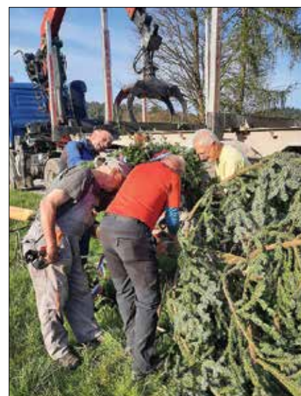
Člani Planinskega društva med postavljanjem mlaja

Člani Planinskega društva Rečica ob Savinji so se tudi v letošnjem letu odpravili na številne poti in pohode, na katerih so raziskovali lepote bližnjih in bolj oddaljenih vršacev.