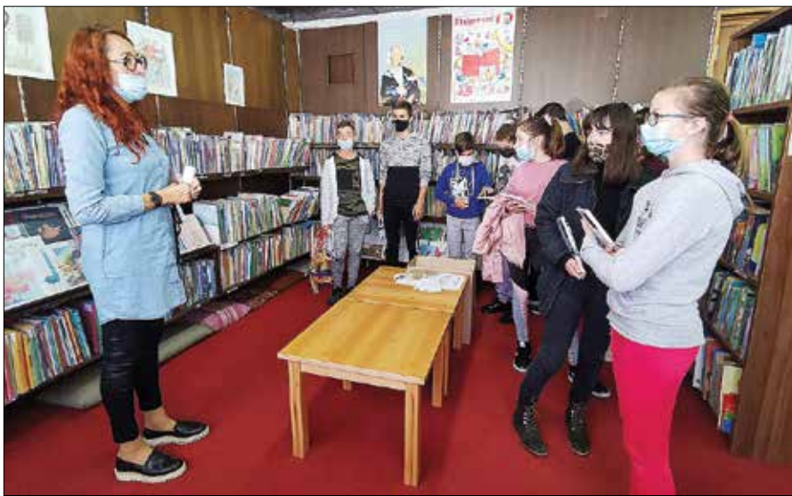
Učenci OŠ na obisku v knjižnici

mere izboljšale in je omogočeno tudi druženje skupin ljudi, vendarle izvedli prvo srečanje bralnega kluba na Rečici ob Savinji, v Mozirju pa so nas v okviru projekta Rastem s knjigo obiskali sedmošolci iz OŠ Rečica ob Savinji.