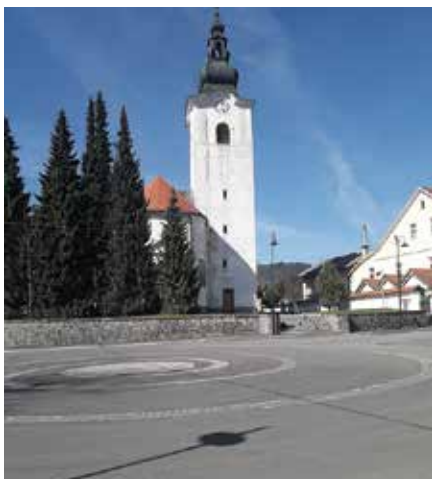
Med operacije LAS sodi tudi gradnja t. i. amfiteatra, ki se bo začela v tem mesecu.

Za sofinanciranje iz Evropskega kmetijskega sklada za razvoj podeželja (EK-SRP) je predvideno podaljšanje programskega obdobja za najmanj dve leti, to je do sredine leta 2025. Gre za t. i. tranzicijsko obdobje, v katerem bodo veljala »sta-