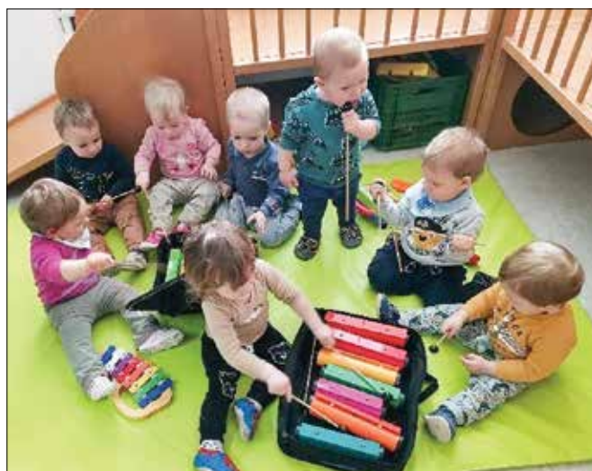
Doživljanje sveta skozi glasbo

V skupini najmlajših veliko časa preživimo ob poslušanju in igranju glasbe. Preko nje svet doživljamo v drugačni luči. Zvok različnih glasbil nas ponese v gozd, na travnik, kmetijo, na nebo in v druge dežele. Poslušamo najrazličnejše vrste glasbe, jo ustvarjamo z glasbili in telesom in zraven prepevamo in plešemo. Vsako novo glasbilo, njegov zvok, otroke navduši in radi se preizkusijo v igranju. Tako smo se letos srečali z zvončki, bobni, klaviaturami, flavto, kitaro, ukulelami, ksilofonom, trianglom, melodičnimi cevmi in drugim. Najbolj pa so uživali v igranju na ropotuljice, ki smo jih sami izdelali iz odpadne embalaže. Lepo je gledati nasmejane otroške obraze, kako uživajo ob različnih zvokih, se zibljejo in mrmrajo. Glasba je zelo pomembna v našem življenju, nas razvedri, razveseli in bogati.