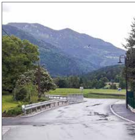
Mržičev most je dograjen.

razpis za izvajalca del je bil že objavljen in končan z izbiro izvajalca – podjetja Novitta. To bo v kratkem pričelo z deli. Dela bodo predvidoma zaključena mesecu avgustu 2020.