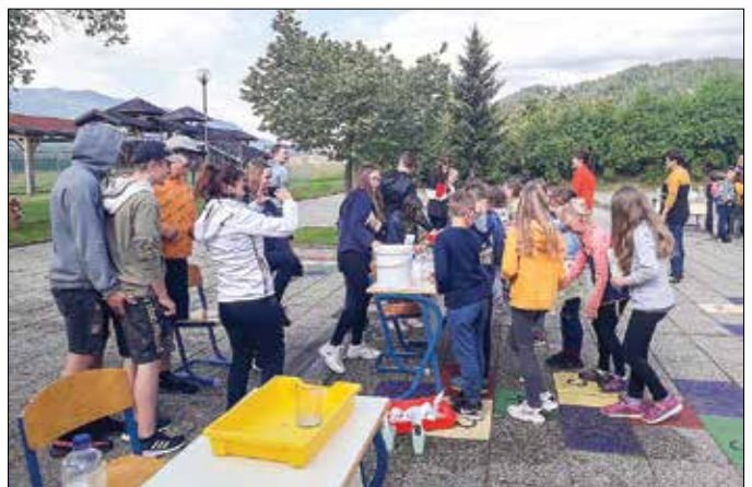
Devetošolci so mlajšim učencem predstavili zanimive poskuse z vodo.