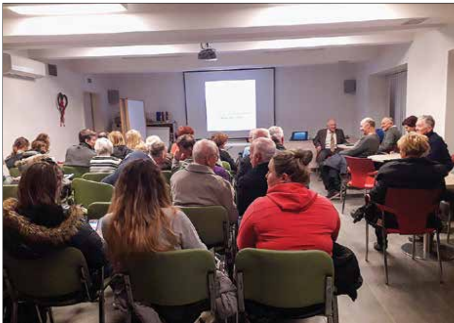
Lani marca so v KUD Utrip pripravili odmevno predavanje o savinjskem splavarstvu.