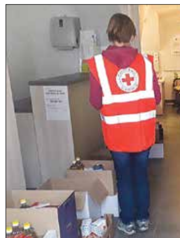
Območno združenje Rdečega križa Zgornje Savinjske doline je v sodelovanju s KO RK in prostovoljkami konec marca tudi v prostorih Medgen borze delilo prehrabne pakete.