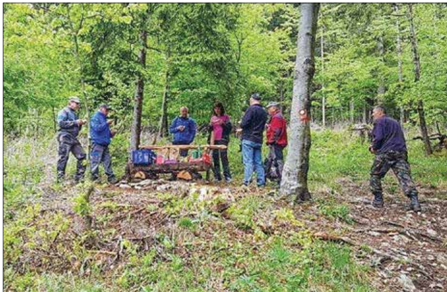
Klop pri Golički domačiji

Studenc pri Beli peči sedaj tudi teče v majhno korito, zato si lahko pohodniki natočijo svežo vodo v steklenico ali pa si bodo pri studencu potešili žejo. Pri koritu bo tudi lonček. Korito in dotok vode je čudovito uredil član PD Rečica ob Savinji. Ob studencu je postavljena sedaj tudi klop, od tam je tudi lep razgled po dolini in na okoliške hribe, ki se dvigujejo na jugu obeh dolin. Še ena klop pa bo postavljena na razgledni točki na najvišjem vrhu občine Rečica ob Savinji, Medvedjeku. Klop je izdelana, vendar zaradi teže materiala prevoz na vrh ni bil mogoč. Bo pa klop v krat-