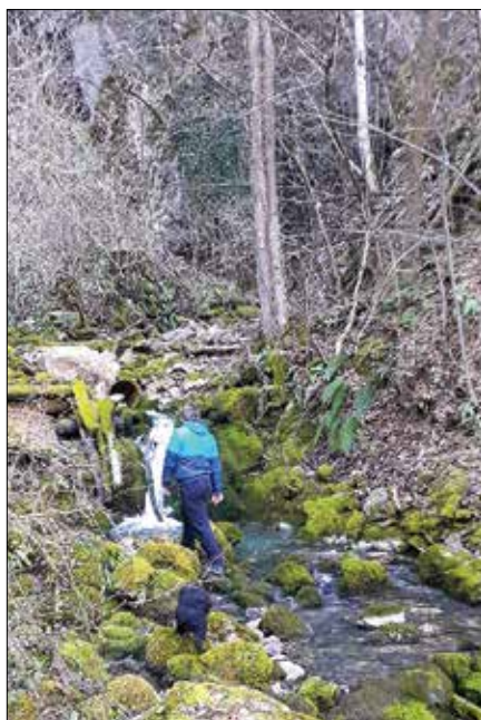
Znane podobe Župnekovega žrela

skupnost tako lahko uporabi različne programe in načine, s katerimi omogoča trajno ravnanje z vodnimi viri. Npr.: spodbuja ljudi k varčevanju z vodo, k recikliranju vode, k uporabi deževnice, k izkoriščanju privatnih virov (vodnjakov) za sanitarno uporabo ali zalivanje. Poleg tega pa izvaja tudi aktivnosti zmanjševanja onesnaževanja voda in osvešča prebivalce o problematiki varčnega ravnanja z vodo in vodnimi viri. Pomembno načelo EU in Slovenije je tudi zagotovitev samooskrbe držav, lokalnih skupnosti in prebivalcev.