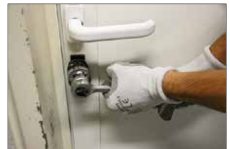
Za lastno zaščito lahko sami storite največ.

Da bi poletni oddih preživeli čim bolj prijetno in varno, vam policisti svetujemo, da še pred odhodom od doma poskrbite za nekaj osnovnih zaščitnih ukrepov. S preventivnim ravnanjem in zavarovanjem svoje lastnine lahko že sami precej zmanjšate priložnosti za izvršitev kaznivih dejanj in se izognete neljubim dogodkom, kot so vplomi v stanovanja, hiše, vozila, tatvine vozil, drzni ropi ipd. Zato pred daljšo odsotnostjo z doma zaklenite vrata in zaprite okna, pred tem ne pozabite zapreti plina in vode ter izklopiti elektrike, predvsem na aparatih (da vam zaradi puščanja vode ali požara ne bo treba predčasno prekiniti dopusta), vklopite alarmno napravo, ključev ne puščajte na »skritih mestih«, kot so nabiralniki, predpražniki, lončki za rože ipd., ne puščajte doma dragocenosti in denarja (med dopustom raje najemite sef), o svoji odsotnosti ne puščajte sporočil (na telefonskem odzivniku, na listkih), poskrbite, da bo videti, kot da je nekdo