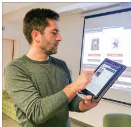
Februarja smo v Medgen borzi predstavili portal Biblos.

Ker je bila Osrednja knjižnica Mozirje zaradi interventnih ukrepov za preprečevanje širjenja epidemije z novim koronavirusom dlje časa zaprta, smo svojim uporabnikom omogočili dostop do različnih elektronskih virov, najbolj iskane pa so bile e-knjige. Izposoja teh je skokovito rasla. Knjižnice so namreč v času karantene ponudile edini način izposoje slovenskih e-knjig preko Biblosa, edi-