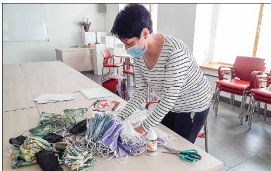
Med drugim smo preko KO RK delili tudi zaščitne maske.

meljsko oblo, ustavil navade, rutine ... V trenutku smo se znašli v položaju, iz katerega smo se počasi začeli prebujati, se veseliti drobnih stvari, se učiti stvari, ki se nam niso zdele pomembne, ko smo imeli kar naenkrat več časa za domača opravila. Učili smo se kuhati, se veselili drobnih stvari, nas je bilo strah, smo si pomagali med seboj. Ali smo ta čas izkoristili v dobro ali obratno?