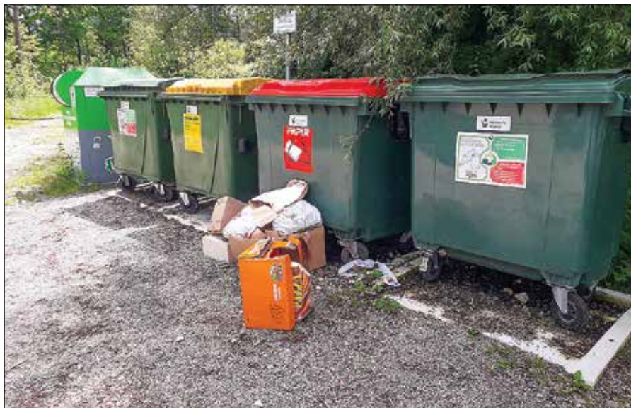
Neprimerno odlaganje odpadkov

V zadnjem času je na območju Varpolj opaziti ponovno kopičenje odpadkov. Žal tudi na posebej občutljivih območjih, na primer ob Savinji, v zavarovanem območju Natura 2000. Neustrezno