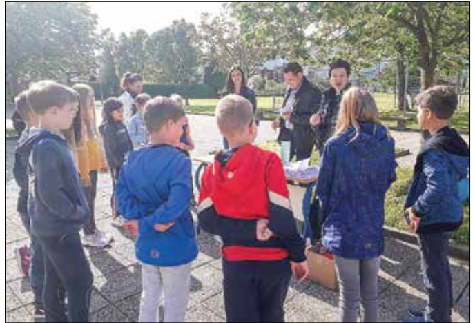
Pomen Žegnanega studenca so predstavili sodelavci občinske uprave in JP Komunala.