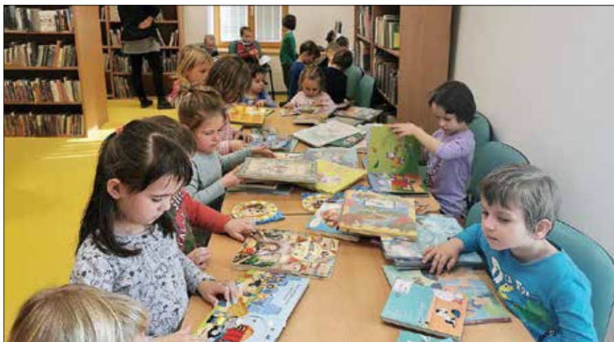
Knjižnico Rečica so obiskali otroci iz vrtca.

Kar se tiče izposoje knjižničnega gradiva na dom in v čitalnici, je leta v lanskem letu v krajevni knjižnici na Rečici dosegla praktično enako izposajo kot leto prej. Člani knjižnice so si v letu 2016 na dom in v čitalnici izposodili 2.617 enot knjižničnega gradiva, v letu 2017 3.518 enot, v letu 2018 že 4.156